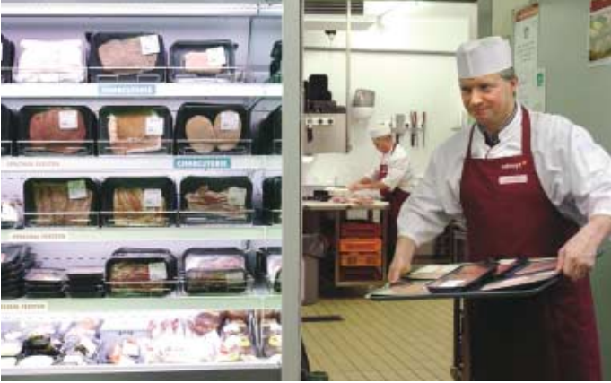
Vers vlees in zelfbediening: uw Colruyt-beenhouwer maakt het vlees ter plaatse verkoopsklaar en verpakt het in schaalpjes.