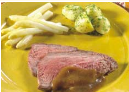
Geflambeerde rosbeef met asperges (uit Smakelijk! 1, p. 151)

Niets beter dan eenvoudige en originele recepten om de smaak van het Colruyt-vlees volop tot zijn recht te laten komen. Heel wat heerlijke en originele recepten met Colruyt-vlees ontdekt u in de Colruyt-folders en Videorecepten. Natuurlijk vindt u ook een ruime keuze in onze kookboeken.