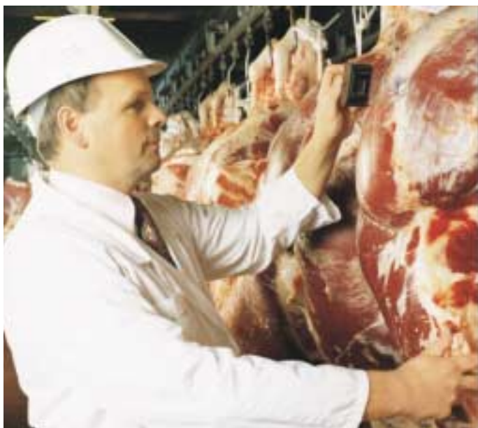
Onze aankoper merkt elk gekocht stuk vlees met de Colruyt-stempel.

We kunnen de herkomst van elk aangekocht rund en kalf perfect natrekken dankzij een speciale 'identiteitskaart' die het dier van bij de geboorte meekrijgt (de Sanitel-kaart). Een kopie daarvan blijft ten minste 3 jaar in ons bezit. Op de kaart staan alle gegevens van dat dier, zoals het stamboeknummer op het oorplaatje, de geboortedatum, het geslacht, de kleur van de vacht, de naam van de veehouder, enz. Zo zijn we zeker van de afkomst van elk dier.