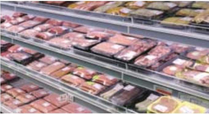
In onze kleinste winkels vindt u een mooi aanbod vers voorverpakt vlees in een koeltoeg.