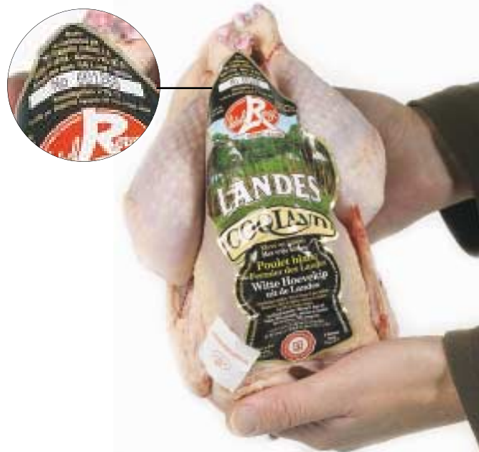
Op elk stuk gevogelte staat een identificatienummer dat verwijst naar een bepaalde kweker.

Ook alle gevogelte (kip, kalkoen, enz.) wordt voorzien van een identificatienummer of streepjescode die verwijst naar een bepaalde kweker en een lotnummer. De hele kippen met een label (Maiski, Rood Label) kunnen we zelfs afzonderlijk identificeren.